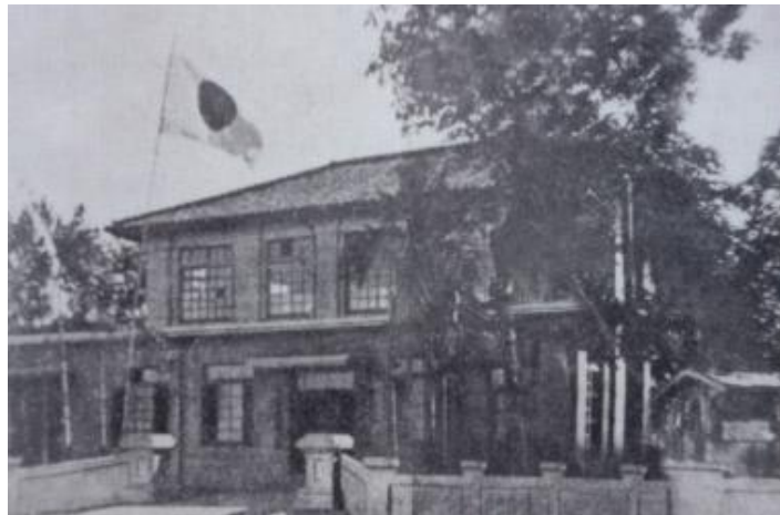
羅東街役場建於 1928 年（昭和 3 年）