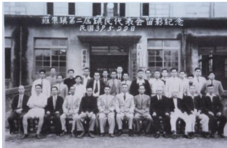
第 2 屆羅東鎮民代表會 (1950 年 (民 39 年))

1994 年(民 83 年)7 月 7 日，立院三讀通過「省縣自治法」，同年(1994)7 月 9 日，由總統公布施行，鎮代會取得地方自治法源地位。自 1950 年(民 39 年)第 3 屆至今，鎮代會代表皆依規定由人民選出。