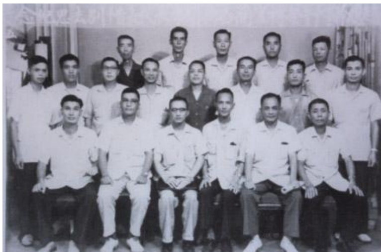
宜蘭各鄉鎮市長惜別去思紀念