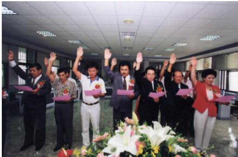
第 16 屆鎮民代表宣誓就職 （1998 年（民 87 年））

鎮民代表在代表會開會時，所有之言論及表決，對外不負責任。於開會期間對代表之逮捕或拘禁，除現行犯外，非經代表會許可，不得為之。