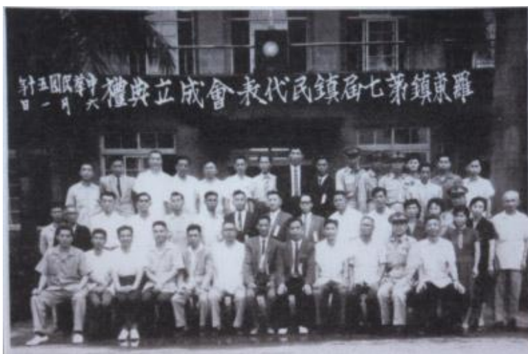
第七屆羅東鎮民代表會成立大會（1961年（民50年））