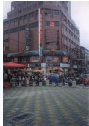
今已改為商業大樓