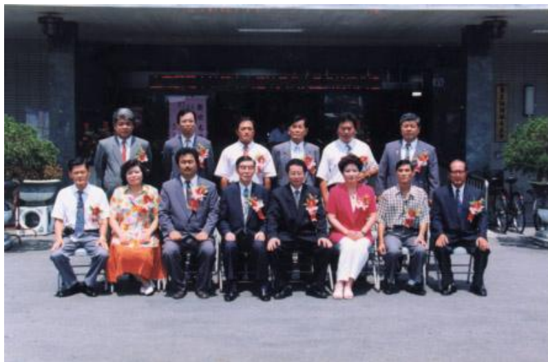
第 16 屆鎮民代表會宣誓就職後留影