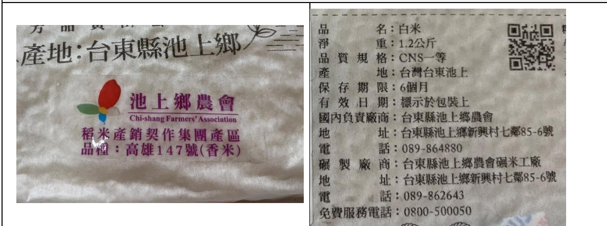
2. 外包裝之品種標示 (文字應清晰)