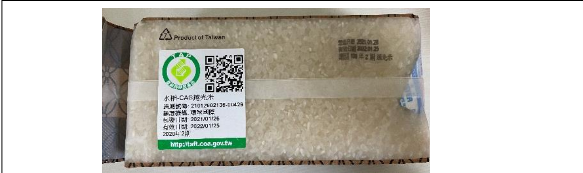
4. 外包裝之驗證標章(文字應清晰)