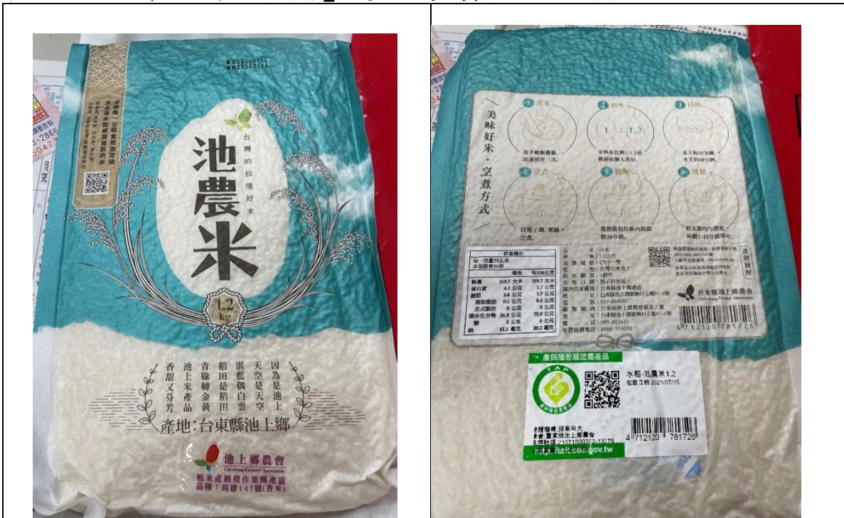
1. 完整包裝產品(內包裝)正反面