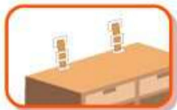
裝卸式移動防止帶