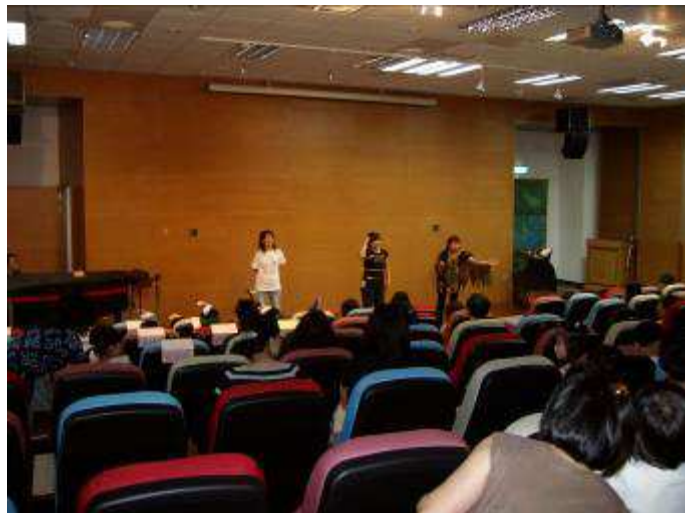
醜小鴨劇團說故事