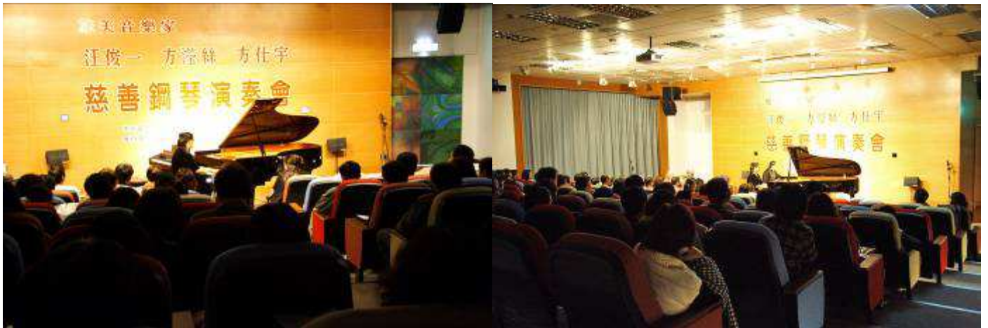
旅美音樂家師生聯合慈善鋼琴演奏會