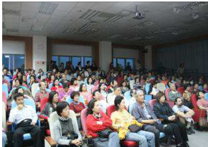
社區大學舉辦講座及電影欣賞