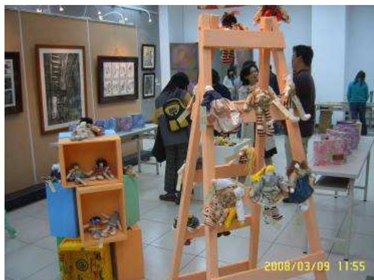
東光國中暨成功國小美術班畢業成果展