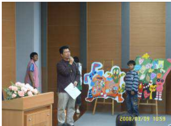
東光國中暨成功國小美術班畢業成果展開幕典禮