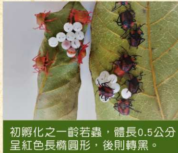
初孵化之一齡若蟲，體長0.5公分呈紅色長橢圓形，後則轉黑。