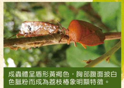
成蟲體呈盾形黃褐色，胸部腹面披白色蠟粉而成為荔枝椿象明顯特徵。