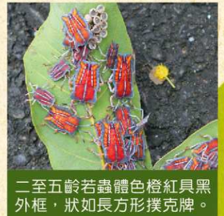
二至五齡若蟲體色橙紅具黑外框，狀如長方形撲克牌。