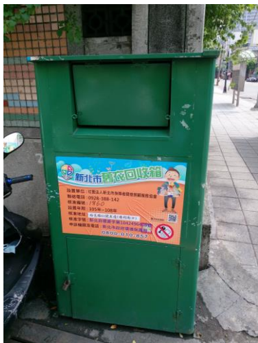
圖 2 合法舊衣回收箱